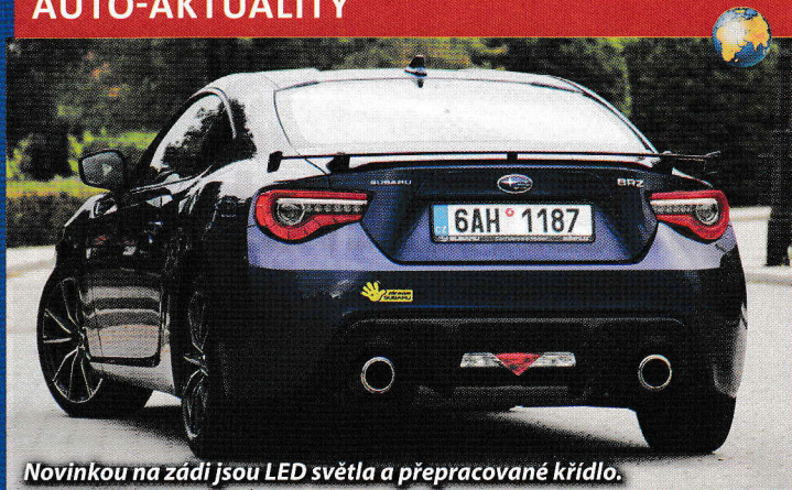
Novinkou na zádi jsou LED světla a přepracované křídlo.

Starlink s vyšší mírou konektivity, nový design volantu a vpravo od dominantního otáčkoměru se objevil barevný displej 4,2" s řadou sportovních funkcí. Výrobce hovoří i o kvalitnějších materiálech ve dveřích, na středové konzoli, před spolujezdcem a ještě v oblasti kolen.