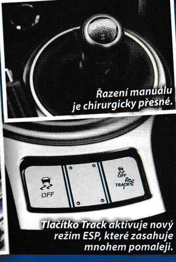
Řazení manuálu je chirurgicky přesné.