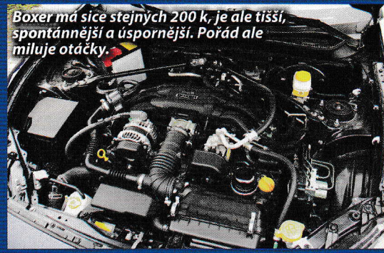
Boxer má sice stejných 200 k, je ale tišší, spontánnější a úspornější. Pořád ale miluje otáčky.

Spoustu práce odvedli konstruktéři. Před modernizací se spekulovalo, že by dvoulitrový boxer mohl i v Evropě posílit z původních 147 kW (200 k) a 205 Nm, jenže parametry se nezměnily. Přesto se toho na motoru udělalo víc než dost. Má modifikované ventily, přepracovaný vačkový hřídel, zesílený blok, odolnější výfukový systém, snížené vnitřní tření nebo nové palivové čerpadlo. Motor ve výsledku není pružnější či ostřejší, ale jemnější a kultivovanější, lépe reaguje na plynový pedál v nižších otáčkách. To nejlepší ale ze sebe boxer stejně vydává až po překročení hranice 4000 ot./min. Slibovaných 200 koní totiž vydolujete až v 7000 ot./min. Byť v tomto pásmu vydává spoustu decibelů, celkové je čtyřválec tišší.