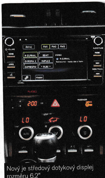
Nový je středový dotykový displej rozměru 6,2"