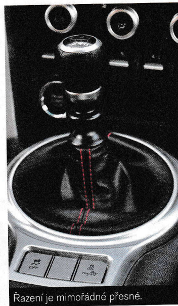
Řazení je mimořádně přesné.

osmi vstřikovačů. Tento systém je znám již z automobilů Lexus. Dvoulitrový boxer má čtvercovou charakteristiku (vrtání i zdvih je 86x86 mm) a bez přepřínování nabízí nadstandardních 147 kW. Bohužel minimální oktanové číslo je stanoveno na 98. S benzinem Natural 95 si poradí také, sníží se ale výkon i točivý moment. Další výjimečnost automobilů tkví v mimořádně nízké provozní hmotnosti, která je jen 1277 kg a v ideálním rozložení