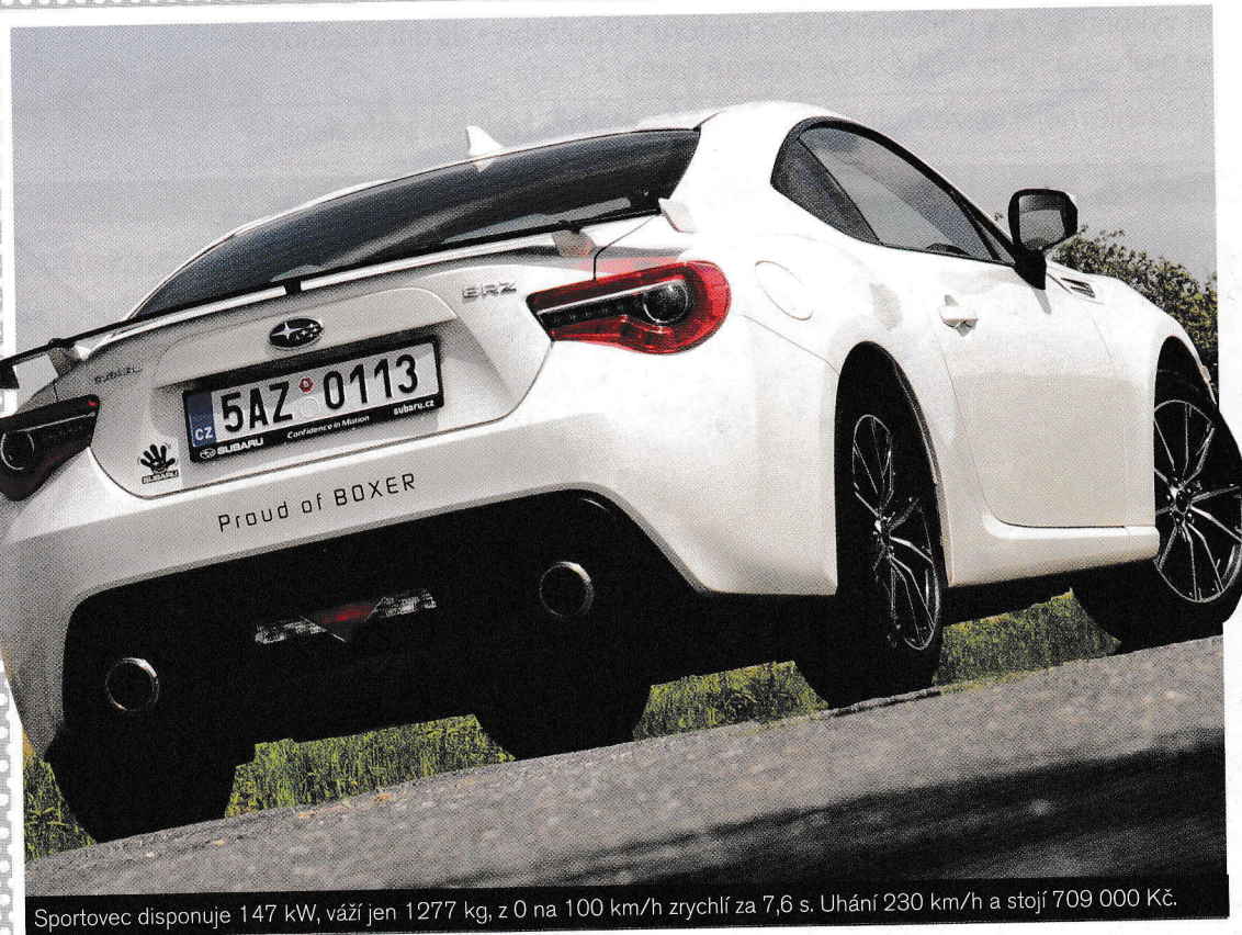
Sportovec disponuje 147 kW, váží jen 1277 kg, z 0 na 100 km/h zrychlí za 7,6 s. Uhání 230 km/h a stojí 709 000 Kč.