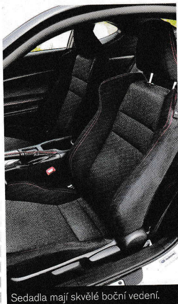
Sedadla mají skvělé boční vedení.