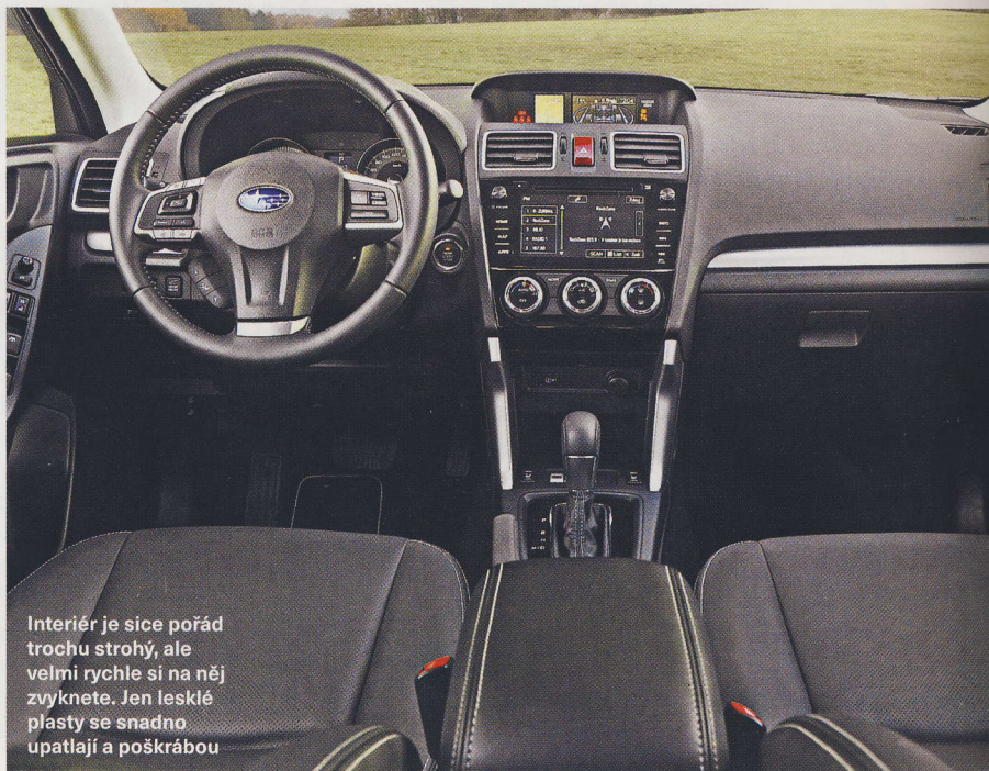
Interiér je sice pořád trochu strohý, ale velmi rychle si na něj zvyknete. Jen lesklé plasty se snadno upatljí a poškrábou

Mimo těchto drobností je život s Foresterem příjemný. Podvozek je nastaven na komfort, navíc je ale stabilní a pohon všech kol v zatáčkách pomáhá k čistě stopě. Jestli hledáte partáka na dlouhé cesty a výlety do terénu, je Forester dobrá volba. Na automat si ovšem připravte nemalý příplatek. Auto s ním stojí o 50 tisíc korun víc. U Subaru jsme si ale zvykli na něco vyšší ceny.