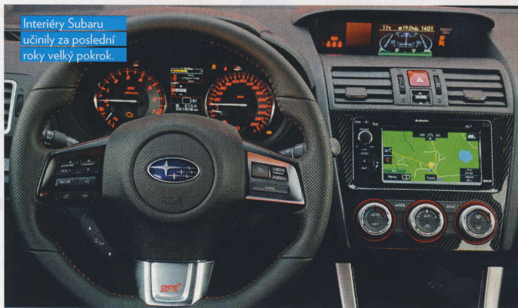
Interiéry Subaru učinily za poslední roky velký pokrok.

naplno na brzdy, trojka a ostře do pravé, rovinka, střední levá, pak pravá a – pak se ztrácím. Jen matně si vybavuji úseky a jedu spíše na oči a na jistotu. STi mě ale uklidňuje svou neochvějnou kombinací tuhé karoserie a pevného podvozku, precizní ovladatelnosti a trakce pohonu všech kol. Stopu drží přísně neutrální, nerozhodí ho ani brzdění v zatáčce nebo příliš plynu na výjezdu, nešikovné lomcování volantem ani potoky vody tekoucí přes silnici. Při druhé jízdě se cítím jistější a tlačím víc na píl, STi naprosto exceluje ostrou obratností a brutální efektivitou na výjezdu... A všichni na palubě blednou strachy, visí na madlech nade dveřmi a zapírají se o interiér. Víte o lepším důkazu rychlosti auta?