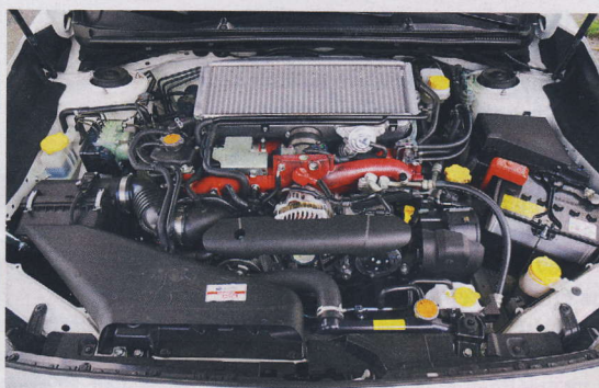
Srdce auta: přeplňovaný čtyřválcový boxer o objemu 2,5 litru disponuje výkonem 221 kW a točivým momentem 407 N.m