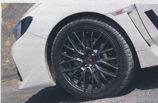
Osmnáctipalcové lehké disky s kvalitním a lepivým obutím jsou základem dynamické jízdy

SILNÝ MOTOR VE SPOJENÍ S POHONEM VŠECH KOL DOKÁŽE Z AUTA DOSTAT ABSOLUTNÍ MAXIMUM. ZRYCHLENÍ Z 0 NA 100 KM/H ZA 5,2 S A MAXIMÁLNÍ RYCHLOST 255 KM/H MLUVÍ ZA VŠE.